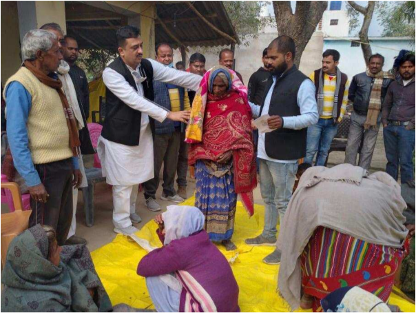
का पुरवा, सुल्तानपुर जनीली, मेलखासाहब, गुरगुजपुर आदि

गावों के गरीब विधवाओं, दिव्यांगों और जरूरतमंदों को कंबल वितरण अभियान के तहत