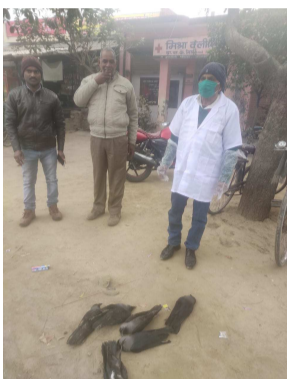
की सुबह भोर पहर सड़क किनारे पेड़ों से टपक कर लगभग आधा दर्जन कौवों की संदिग्ध परिस्थितियों में मौत होने से ग्रामीणों में हड़कम्प मच गया। घटना की जानकारी पुलिस को दी गई सूचना