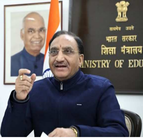
जवाहर नवोदय विद्यालय ने 9 हजार शिक्षकों को प्रशिक्षण दिया है। शिक्षा मंत्री ने कहा कि छात्रों के मानसिक स्वास्थ्य को सही रखने के लिए शिक्षा मंत्रालय ने काफी काम किया है। इसके लिए मंत्रालय ने फिट इंडिया में केंद्रीय शिक्षा मंत्री ने कहा कि

मंत्रालय ने निष्ठा कार्यक्रम के जरिये शिक्षकों के प्रशिक्षण का कार्यक्रम शुरू किया है। सीबीएसई ने अप्रैल से अगस्त के बीच करीब 4 लाख 80 हजार शिक्षकों को ऑनलाइन प्रशिक्षण दिया है, वहीं केबीएस ने 15 हजार शिक्षकों को प्रशिक्षित किया जबकि