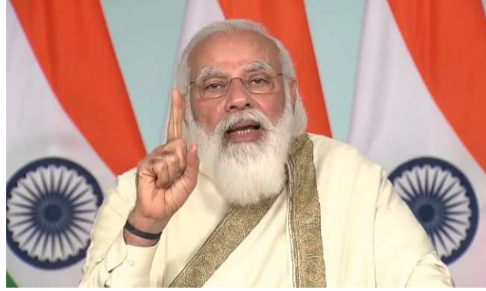
2 करोड़ से ज्यादा गरीबों को पक्के घर दिए गए। बिना भेदभाव 8 करोड़ सभी अपने सपने पूरे करें। सबका साथ-सबका विकास-सबका विश्वास

से ज्यादा महिलाओं को गैस मिला। उन्होंने कहा कि देश आज उस मार्ग पर बढ़ रहा है जहां मजहब की वजह से कोई पीछे न छूटे, सभी को आगे बढ़ने के समान अवसर मिले, ये मंत्र मूल आधार है। देश की नीयत और नीतियों में यही संकल्प झलकता है। प्रधानमंत्री ने कहा कि आज एएमयू से तालीम लेकर निकले सारे लोग भारत के सर्वश्रेष्ठ स्थानों पर ही नहीं बल्कि दुनिया के सैकड़ों देशों में जाए हुए हैं। एएमयू के पढ़े लोग दुनिया में कहीं भी हों, भारत की संस्कृति का प्रतिनिधित्व करते हैं। पहले मुस्लिम बेटियों को स्कूल ड्रॉपआउट रेट 70: से ज्यादा था वो अब घटकर करीब-करीब 30: रह गया है। पहले लाखों मुस्लिम बेटियां शौचालय की कमी की वजह से पढ़ाई छोड़ देती थीं, अब हालात बदल रहे हैं। मोदी ने कहा कि नई राष्ट्रीय शिक्षा नीति में 21वीं सदी में भारत के छात्र-छात्राओं की जरूरतों को सबसे ज्यादा ध्यान में रखा गया है। हमारे देश के युवा Nation First के आह्वान के साथ देश को आगे बढ़ाने के लिए प्रतिबद्ध हैं।